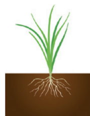
DESARROLLO FOLIAR (4-10 HOJAS)