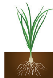
INICIO DE FORMACIÓN DE BULBO